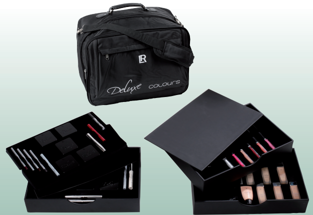
Beauty Bag Deluxe (52 Deko-Produkte)