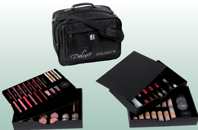
Beauty Bag LR Colours (101 Deko-Produkte)

Wählen Sie für Ihren Einstieg die passende Beauty Bag oder gleich das komplette Set aus (die genaue Auflistung der jeweiligen Inhalte finden Sie auf Seite 3)